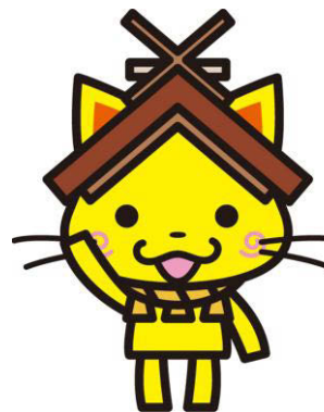
島根県観光キャラクター しまねっこ 高観通許第1207号