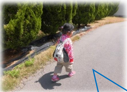
お散歩♪ 天気良くて気持ちがいいな～♪