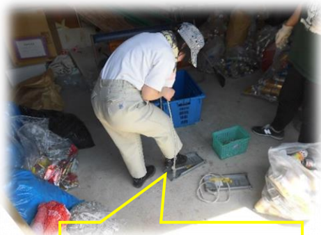
空き缶つぶし！！ がんばっています！！