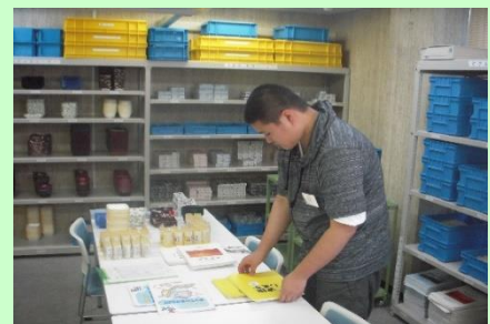
島根障害者職業センター実習風景

この実習に対し、松江のアルソアの社長さんのご厚意で住居を提供していただき大変有り難く思っています。